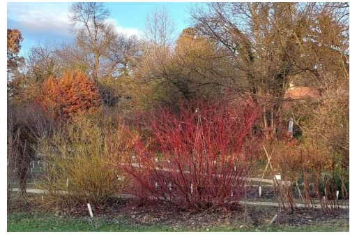
sárga és vörös vesszőjú somok