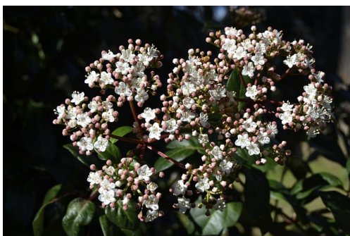
illatos téli bangita

Az illat nem kizárólag a tavaszi és nyári időszakra jellemző. Egyes növények, mint például a téli bangita és a varázsmogyoró kellemes illatúak. Az illatos virágokkal tarkított téli kert érzékszervi gyönyört nyújt, illatörömek felfedezésére és megtapasztalására csábítja a látogatókat.