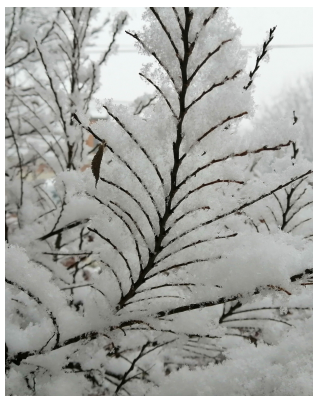
havas törpe szil

Téli kertünk szépségét a hó és dér tovább emeli. A díszfüveken , a terméseken és ágakon megült hó varázslatos és elbűvölő hangulatot teremt. A finom kristályos szerkezetek és az érintetlen fehér burkolat a kertet téli csodaországgá varázsolhatja.